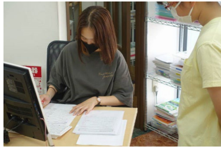
理社は満点合格するまでテスト

基本は5科目をバランス良く演習できるように、塾専用教材の中から生徒に応じたものを与えます。