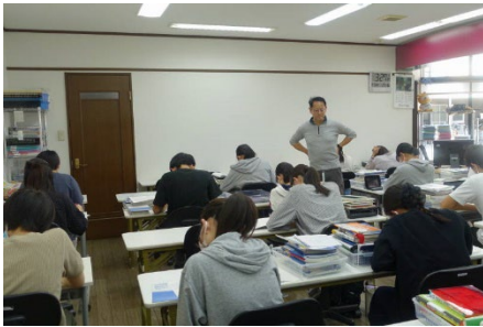
このように集中した姿勢で毎日9時間やりました