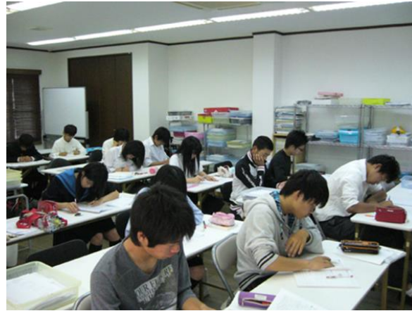
早朝授業の様子です。集中して演習しています。中学生、高校生、私立、公立どなたでも大丈夫!